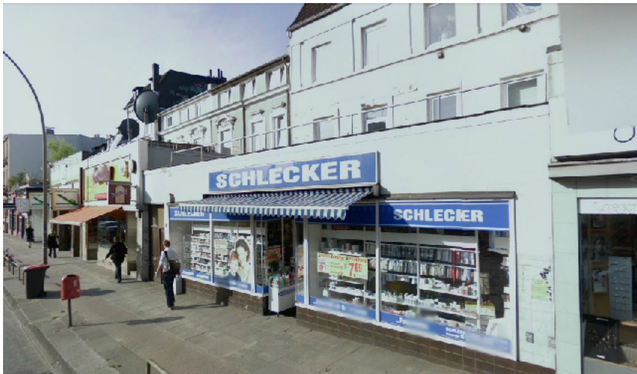
Bei Hoheluftchaussee 83, 20253 Hamburg

worin also i den Einbegriffungsgrad, m die Stufung, und n die Reihung angibt. Zur Illustration gehen wir vom folgenden realen Beispiel aus: